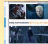
CD With All My Heart Best.-Nr. 946 340