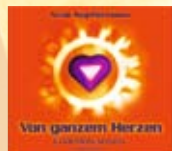
CD Von ganzem Herzen Best.-Nr. 946 185