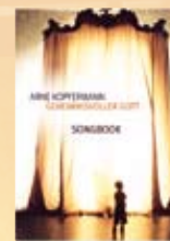
Songbook Geheimnisvoller Gott Best.-Nr. 857 422