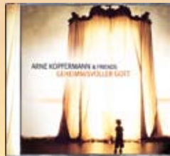
CD Geheimnisvoller Gott Best.-Nr. 946 367