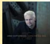
CD Vergiss es nie Best.-Nr. 946 307